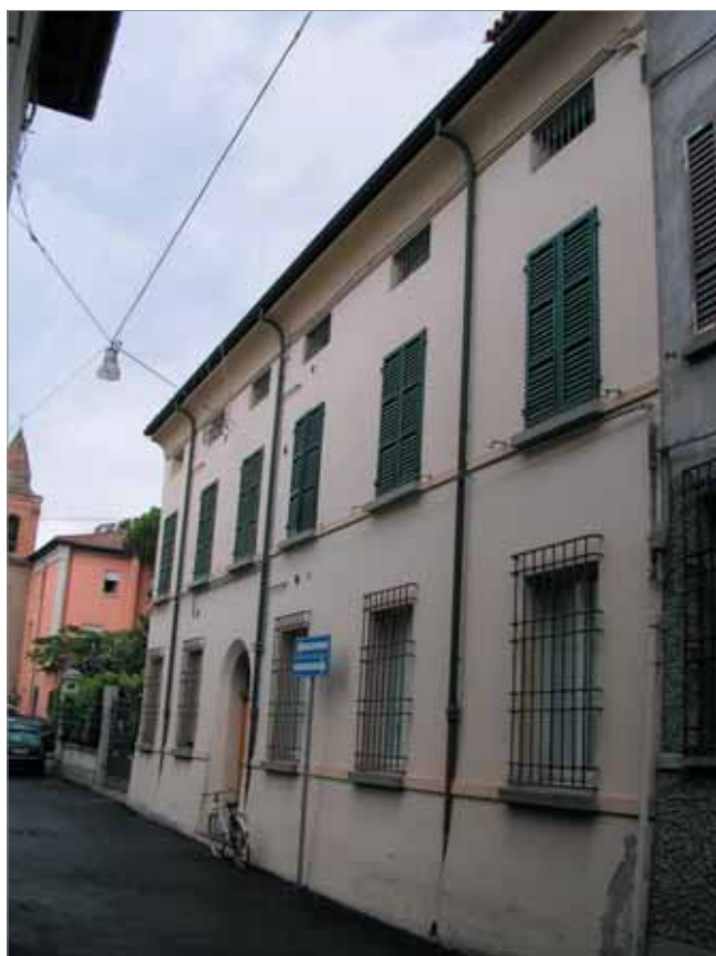
Via Garzoni 20 Fronte Principale